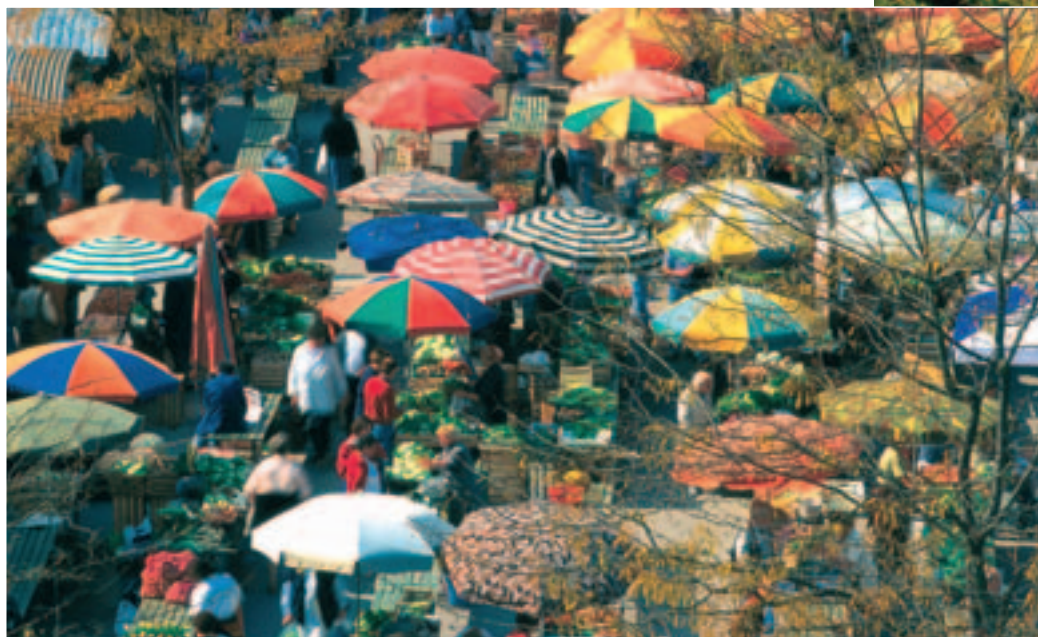
Just as colourful and lively as the rest of Ljubljana: the Market square.

That really puts Slovenia in Europe's economic Ivy League, and that actually comes as no big surprise, as Slovenians are characterized as being industrious, thrifty and reliable. All these are strong arguments also for international meeting and incentive organizers to have a closer look at Slovenia. The Slovenian Convention Bureau was founded just about two years ago in order to improve the country's marketing activities aimed at exploiting this potential. The non-profit organization