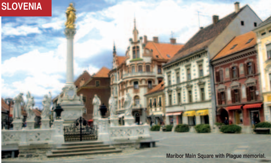
Maribor Main Square with Plague memorial.

Nouveau façade to be entirely cleared and rebuilt into a 5-star hotel. Management pointed out that meeting capacities will also be provided for 250 persons. Life-Class bases its business on regular tourism, on meeting and incentives, and on wellness arrangements. The very flexible multi-purpose Congress Center Portus makes seven different rooms on an area of 1,600 square meters available for groups of between 20 and 520 persons. The center's Magellan room is of outstanding artistic value; Ivo Kisovec decorated this room with Renaissance-style wall paintings about Magellan's voyages around the world.