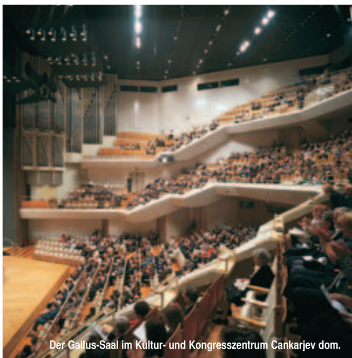
Der Gallus-Saal im Kultur- und Kongresszentrum Cankarjev dom.

Alpen oder Meer? Quirliche Städte oder ruhige Kurorte? Action oder Entspannung? Zweckgebaute Kongresszentren oder historische Tagungsstätten? In Slowenien muss die Entscheidung für das Eine das Andere nicht ausschließen. MICE-Veranstaltern bleibt lediglich die Qual der Wahl.