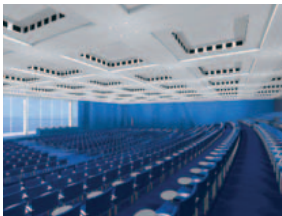
Das Grand Hotel Bernardin und seine beeindruckende Europa Convention Hall.