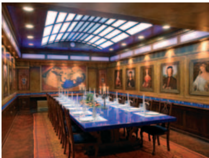
Magellan room at the Conference Centre Portus of LifeClass Resort Portorož.

Larix Wellness Centre complement these facilities well and are ideal locations for social programs and incentives.