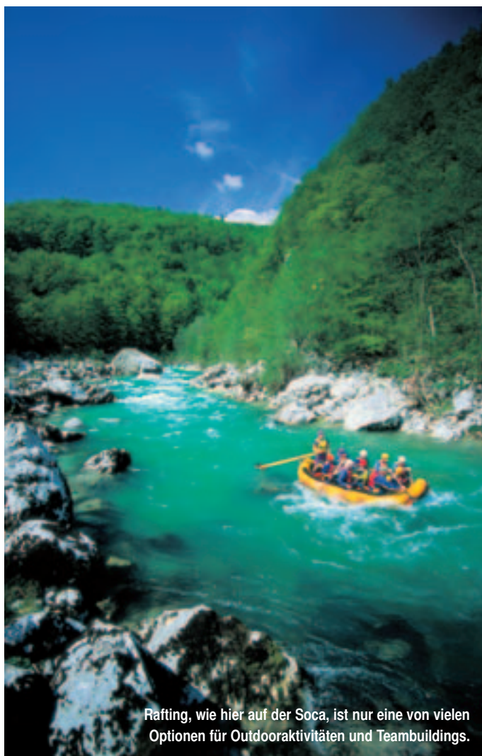
Rafting, wie hier auf der Soca, ist nur eine von vielen Optionen für Outdooraktivitäten und Teambuildings.

Slowenien bedeutet für MICE-Veranstalter vor allem Vielfalt auf kleinem Raum. Ob alpine Umgebung oder mediterranes Ambiente, ob Kurorte und Thermalbäder oder quirlige Städte mit einzigartiger historischer Architektur. Das Schöne daran: Die eine Möglichkeit schließt die andere nicht aus. Vielmehr lassen sich diese Angebote durchaus auch miteinander kombinieren. So sind es vom Flughafen Ljubljanas nach Städten wie Bled oder Kranjska Gora nur 31 bzw. 63 Kilometer, nach Portoroz 142 Kilometer, nach Nova Gorica 129 und nach Rogaska Slatina 130 Kilometer. Angesichts des gut ausgebauten Straßennetzes sind daher etwaige Transfers wenig zeitaufwändig. Und auch eine Anreise über die Airports im italienischen Triest oder dem österreichischen Klagenfurt gestaltet sich problemlos. Im Folgenden sollen einige der Regionen und ausgewählte Leistungsanbieter vorgestellt werden.