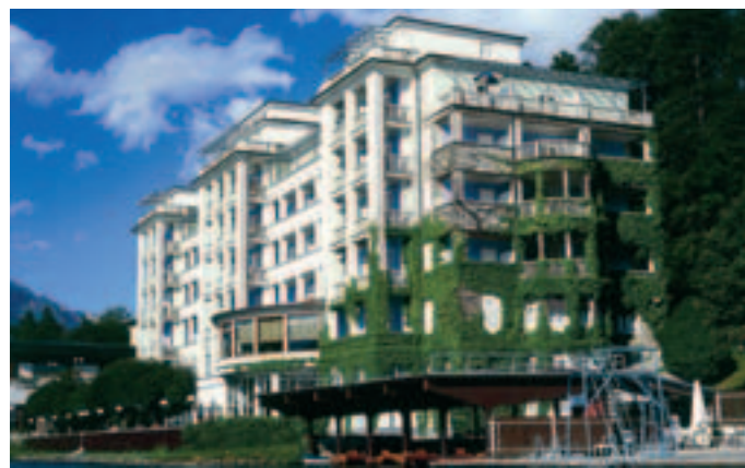
In exzellenter Lage: Das Grand Hotel Toplice direkt am Bleder Seeufer.

Wenn es um begleitende Outdoor- und Teambuildingaktivitäten geht, arbeitet das Hotel Habakuk ( www.termemb.si ) eng mit dem Team des Sport-Centers Pohorje zusammen, das je nach Kundenwunsch entsprechende Programme im Gebiet des Pohorje Plateaus zusammenstellt. Die Palette reicht dabei vom Hochseilgarten über Mountainbiking, Bogenschießen, Rodeln, Reiten, Paragliding, Kursen im Nordic Walking bis hin zu Übungen auf der neuen Golf Driving Range. Die Referenzliste der Kunden umfasst unter anderem Profi-Fuß-