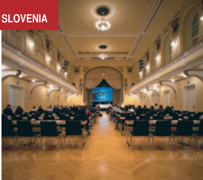
Besonders stilvoll: Der große Saal im Grand Hotel Union, Ljubljana.

Quadratmeter große Saunalandschaft sowie weitere 7.500 Quadratmeter, auf denen unter anderem ein Thalasso-Center, ein Schönheitscenter, ein medizinisch-physiotherapeutisches Center sowie seit diesem Jahr auch ein neues Ayurveda Center untergebracht sind. Jeweils auf Wochen im Voraus ausgebucht ist ferner das Wai Thai-Center, in dem von thailändischem Fachpersonal die traditionelle thailändische Massage verabreicht wird. www.liefeclass.net