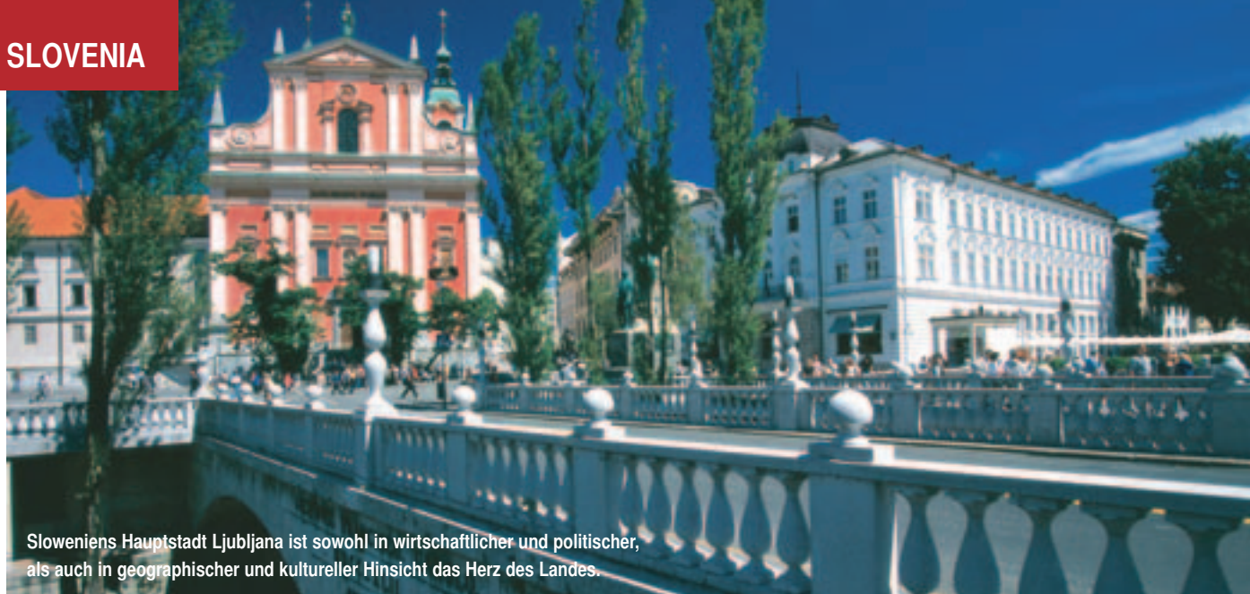
Sloweniens Hauptstadt Ljubljana ist sowohl in wirtschaftlicher und politischer, als auch in geographischer und kultureller Hinsicht das Herz des Landes.