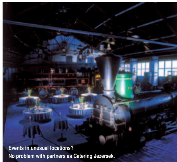
Events in unusual locations? No problem with partners as Catering Jezersek.

Sports and teambuilding activities for groups of up to 200 persons, especially rafting on the Soèa river, canyoning, as well as a variety of winter sports. www.socarfting.si